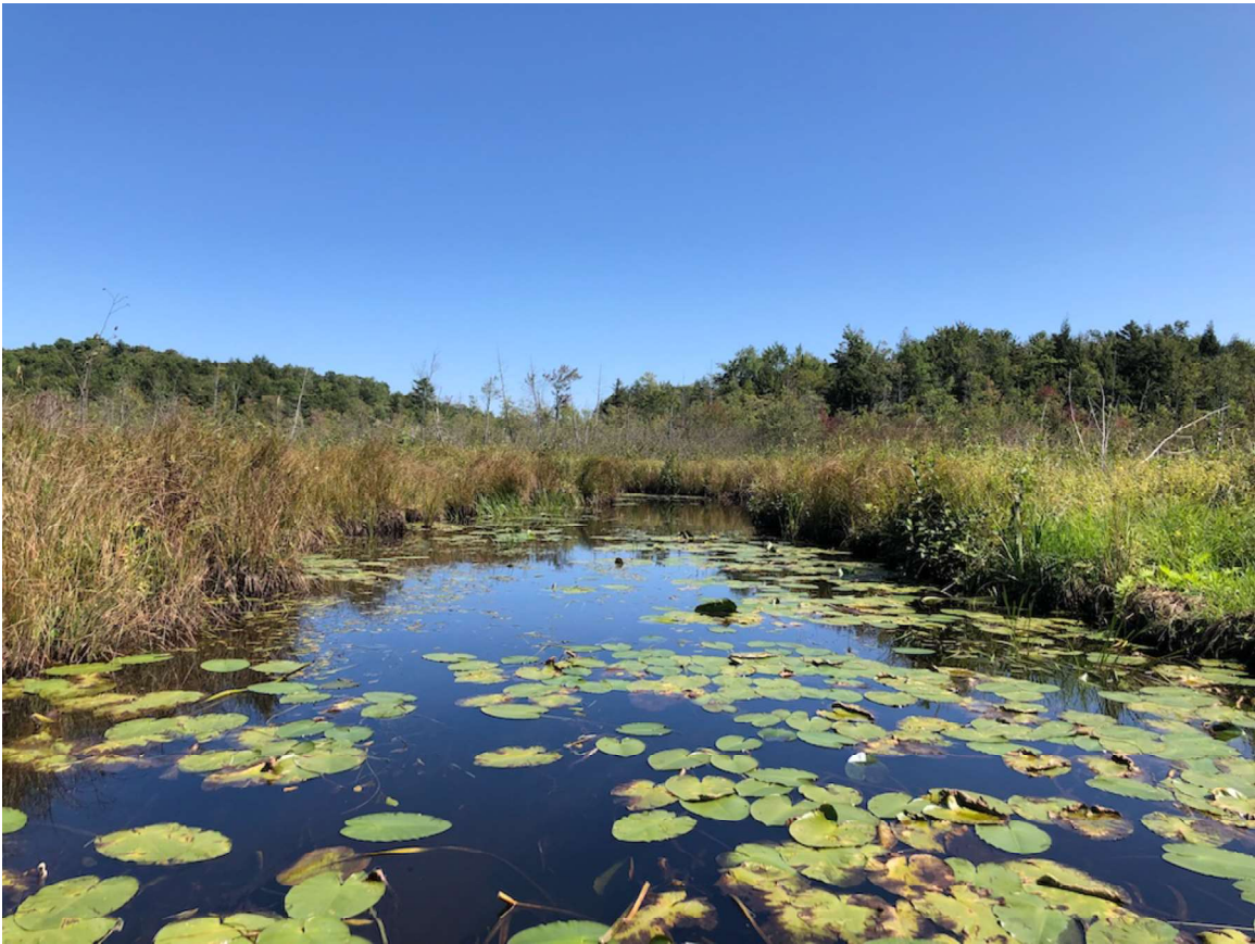
Grand milieu humide de la rivière de l'Est